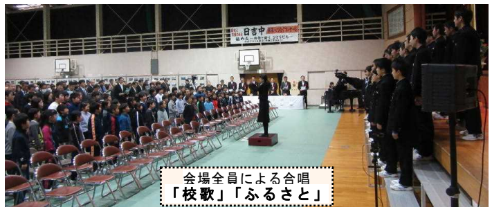
会場全員による合唱 「校歌」「ふるさと」

むすびに、これまで、長きにわたり日吉中学校の発展を支えていただきました、関係の皆様へ深く感謝申し上げますとともに、日吉の郷が益々栄え、更に発展していくことを心より祈念し、私のお別れの言葉とさせていただきます。